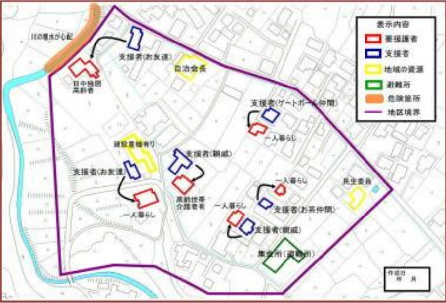
災害時助け合い・住民支え合いマップのサンプル