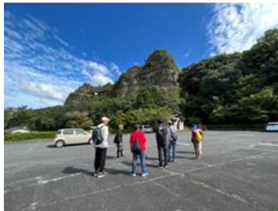
本耶馬溪町 古羅漢の景