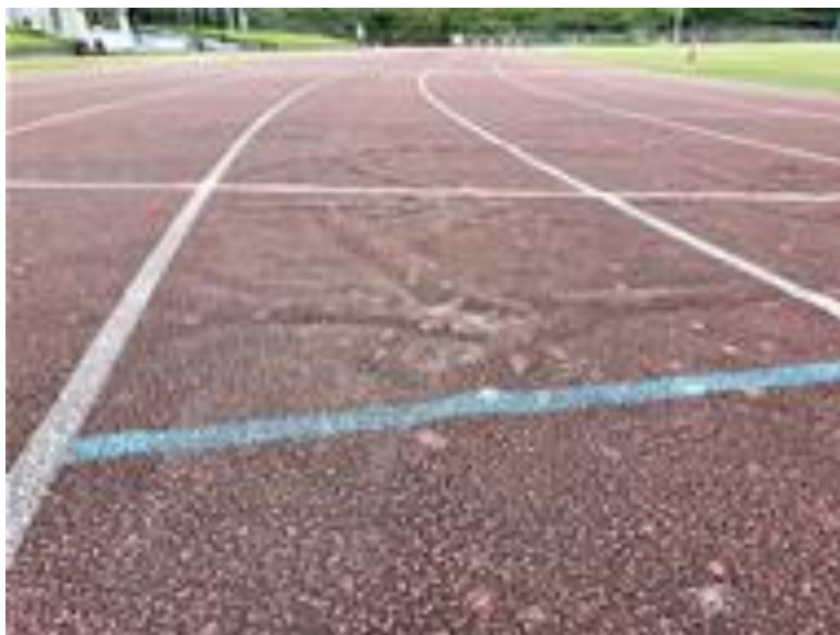
三光陸上競技場の浮上ったラバー