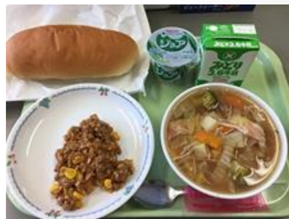
中学生の学校給食の一例