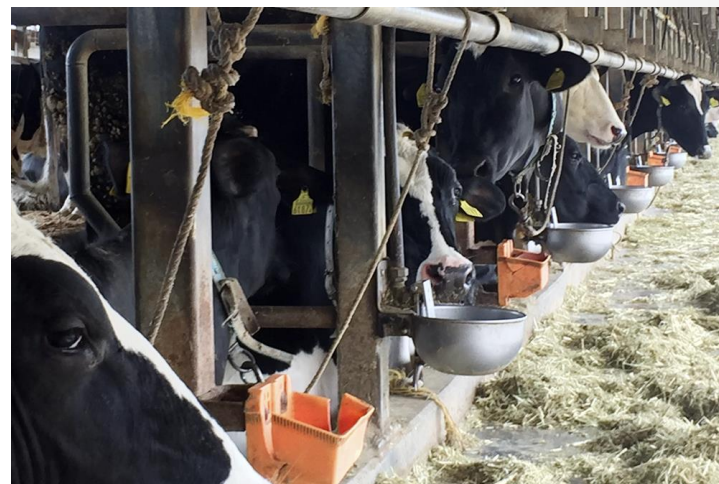
耶馬溪町の宮下牧場