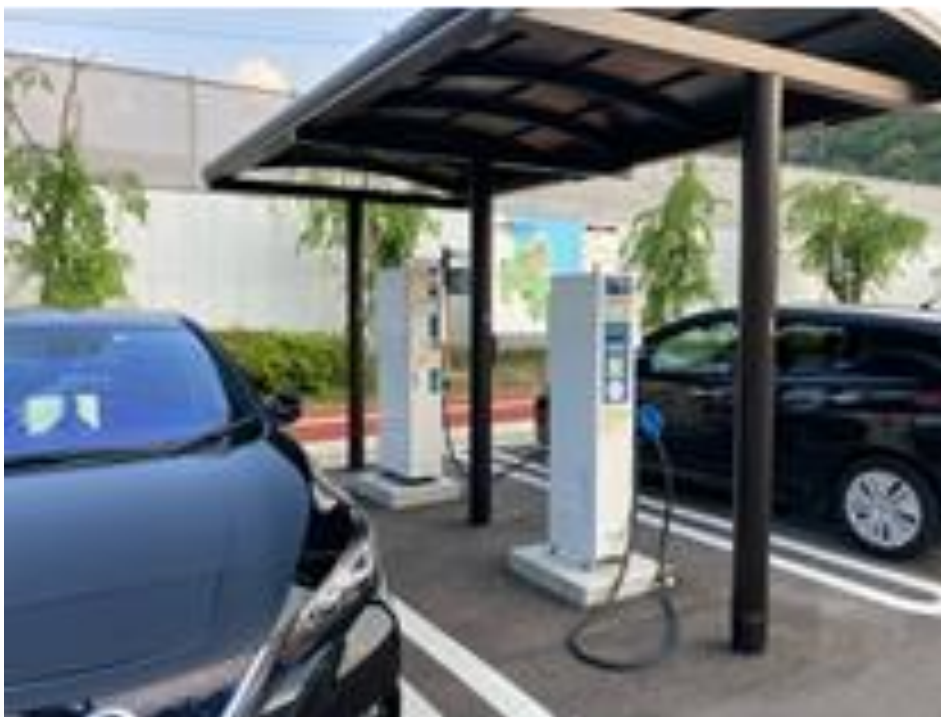
道の駅耶馬トピアの充電設備