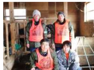
牛ふんの片付け作業を終わって