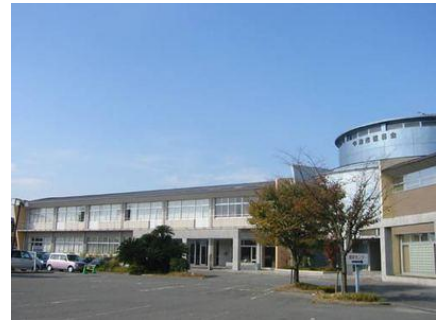
中津ファビオラ看護学校

□看護師等養成のための遠隔教育環境整備事業補助金；306万円 ・中津市医師会立中津ファビオラ看護学校に対し、タブレットの購入等遠隔授業の環境整備に係る経費の一部を補助する。