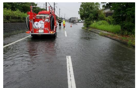
冠水した終末処理場西側道

避難訓練については、防災士の皆さん等のご協力を頂きながら、地域の災害リスクに沿った取り組みを進めたいと思います。