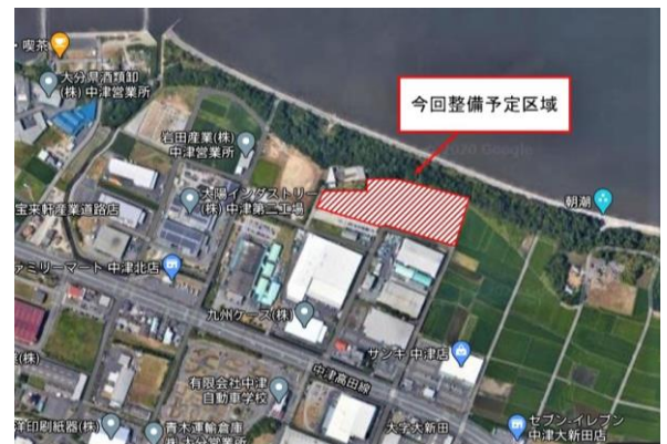
大新田北工業団地第4工区