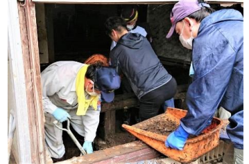
災害ボランティア(日田市)