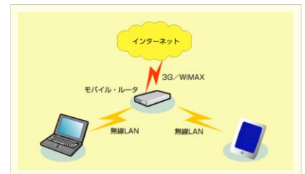
モバイルルーターのイメージ

就学支援の対象拡充 小・中学生が世帯にいて、 失業・休業等で家計が急変した世帯も対象に