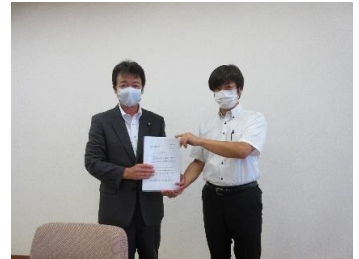
飲食業組合との意見交換会