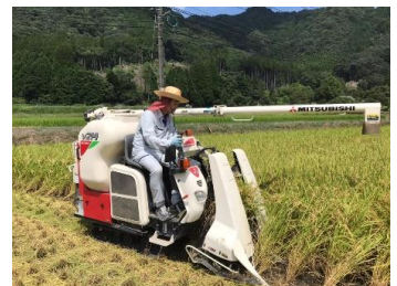
みどりさん家稲刈り体験