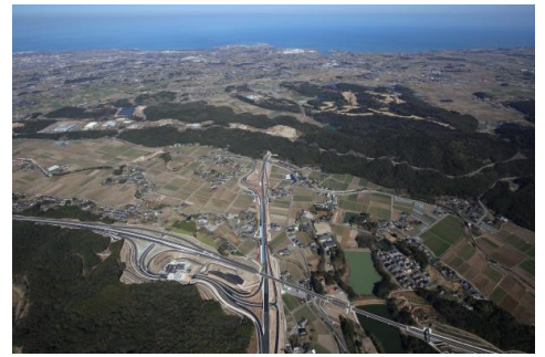
中津日田道路三光 | C

今後も、これらの候補地や市有地も含め、企業ニーズを踏まえ、用地の造成を検討していきたいと考えております。