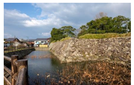
中津城の黒田の石垣