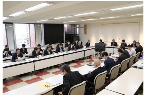
新型コロナウイルス感染症対策本部

今後、新型コロナウイルスの収束、とりわけ、ワクチンや治療薬の開発には、まだ相応の時間がかかると見込まれますので、引き続き状況をしっかり見ながら、国・県・市が一体となり、また、市を挙げて支え合いながら、全力で新型コロナウイルスの対策に取り組んでまいります。