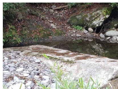
大野水路の取水堰