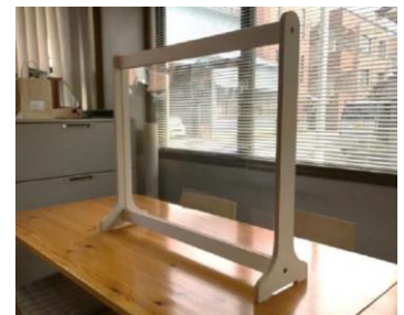
飛沫防止板のイメージ

□感染防止対策補助金；1億4,700万円 ・感染防止対策補助金（備品購入等の補助）について、新しい生活様式への対応のため、 現行の飲食業から全業種へ補助対象を拡大する。