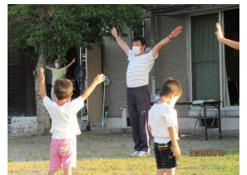
新大塚町夏休みラジオ体操