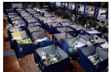
パーテーションのイメージ