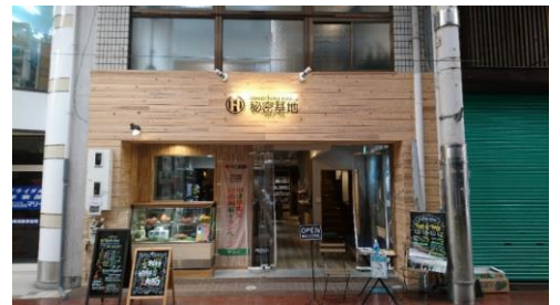
テレワークが可能な「秘密基地中津（日ノ出町商店街）」

その他、ソフト分野については、業種の幅が広いので、必要に応じて制度の見直しも考えてまいります。