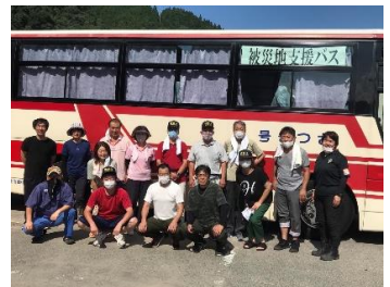
災害ボランティア(日田市)