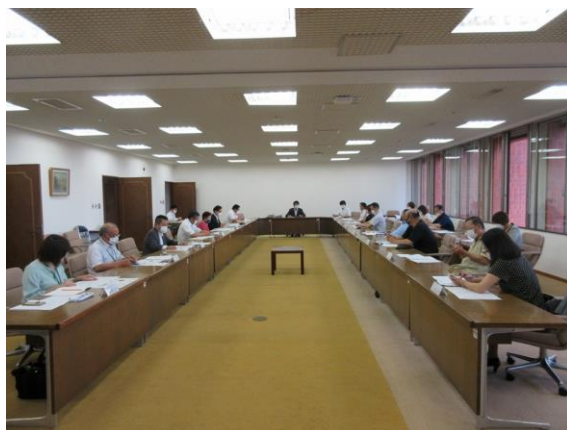
新型コロナウイルス感染対策に関する中津市飲食業組合と総務企画消防委員会との意見交換会（7/25）

私も、自らの知恵やアイデアを最大限に活かしながら、コロナショック後の新たな時代の流れをつくるために頑張ります。