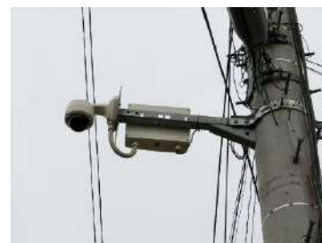
防犯カメラのイメージ

・肉質にオレイン酸の遺伝子を有する県種有牛の人工授精や受精卵移植に係る経費の一部を補助