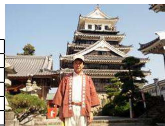
まちなみ歴史探検(小楠小)