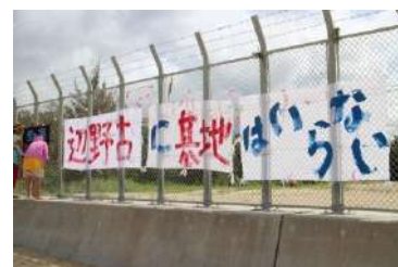
辺野古の基地建設予定地