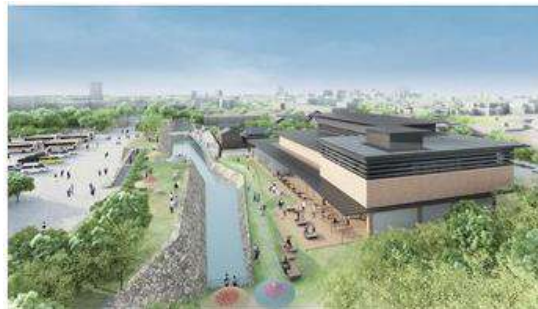
新歴史民俗資料館整備イメージ図

整備方針として、「城下町を回遊する楽しさを、街並みや道筋の町割り構成を背景とした個性ある景観づくりを行うことにより演出するとともに、街全体の景観づくりに向けた取り組みを強化する。また、区域内の観光資源を回遊しながら楽しむ道路整備に取り組む。」となっており、これまでは「城下町まるごとミュージアム構想」で事業を進めてきたと言えます。