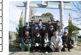
八社神社の門松づくり