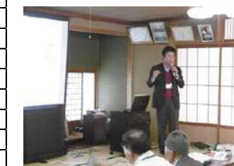
なぎさサロン(市政報告)