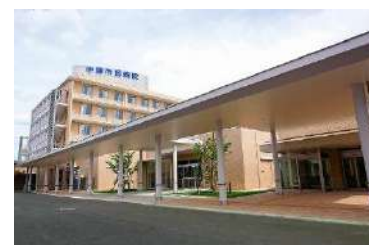
病床不足の市民病院