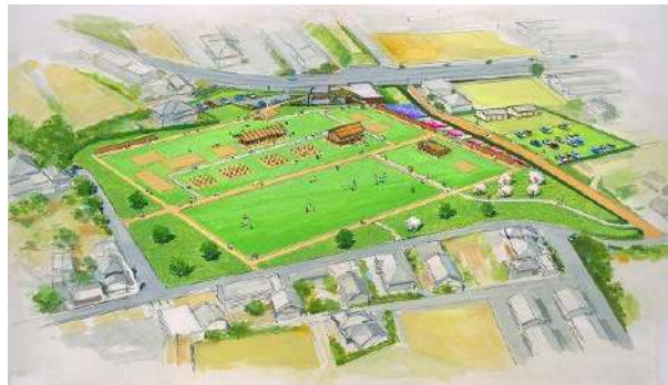
長者屋敷官衙史跡公園整備予定図（案）

市の財政の硬直化を示す経常収支比率（市の適正値75%）は平成26年度決算では93.6%と高止まりし、今後も厳しい財政運営が続くと見込まれます。