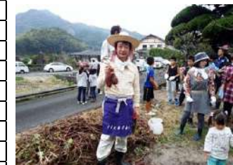
にっぽん酒をつくる会芋掘り