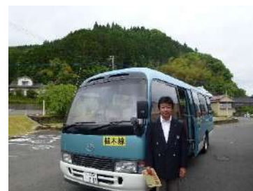
新型バスが導入される槻木線