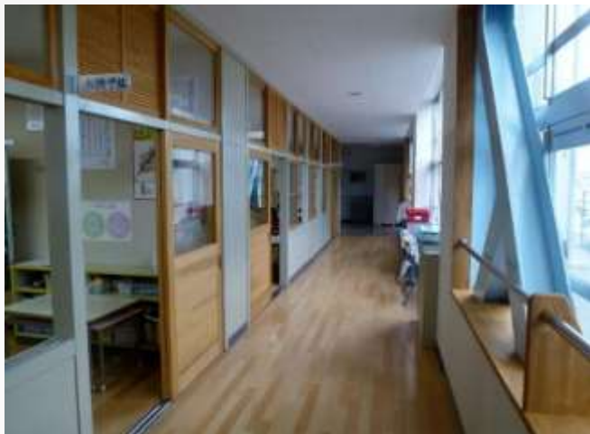
如水小の耐震、内装工事の様子