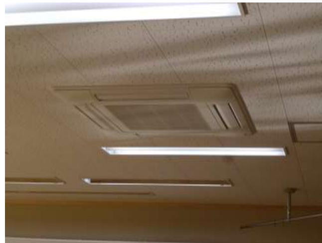
城北中学校のエアコン