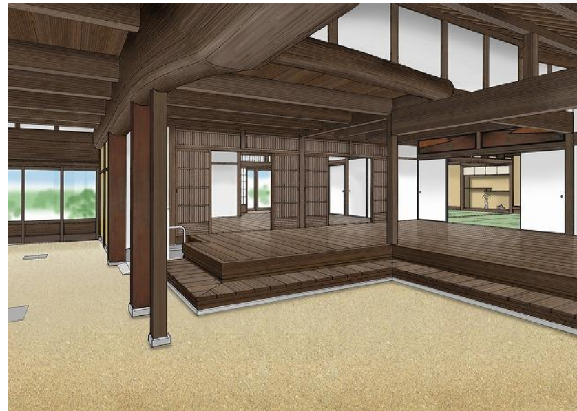
南部まちなみ交流館整備イメージ図