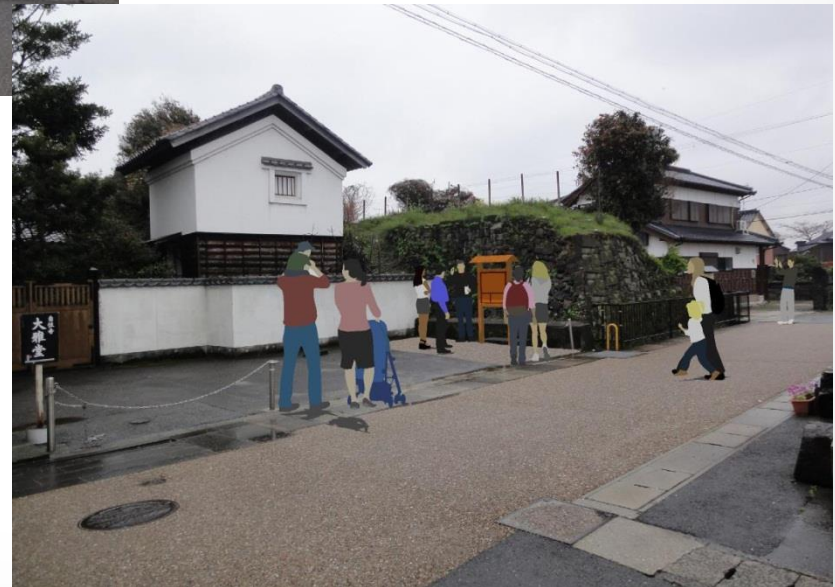
城戸口広場（広津口）の整備イメージ