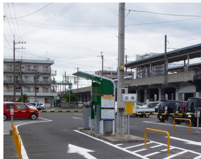
駅北口駐車場のゲート