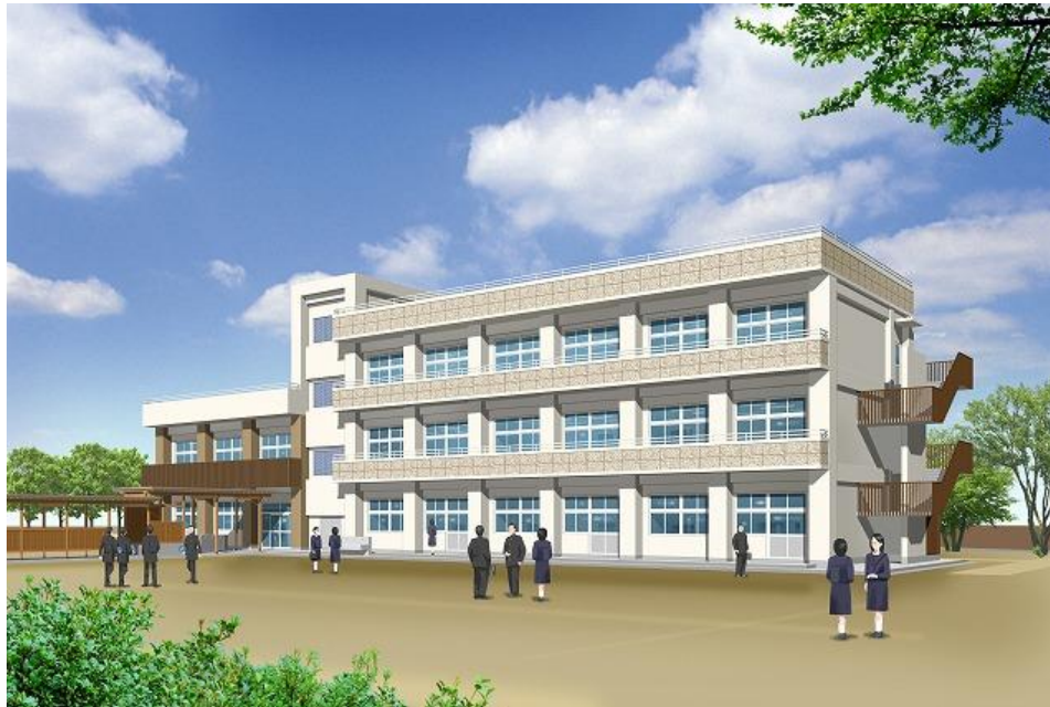
城北中校舎整備イメージ図