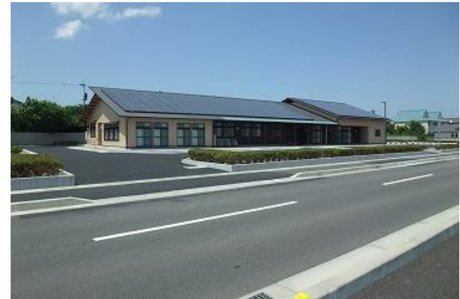
大幡コミュニティーセンター