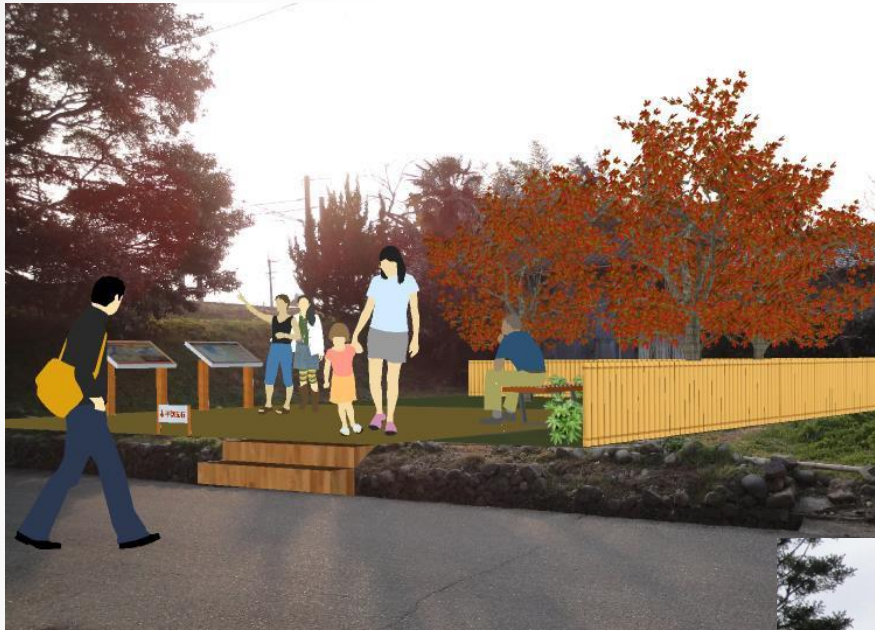
城戸口広場（金谷口）の整備イメージ